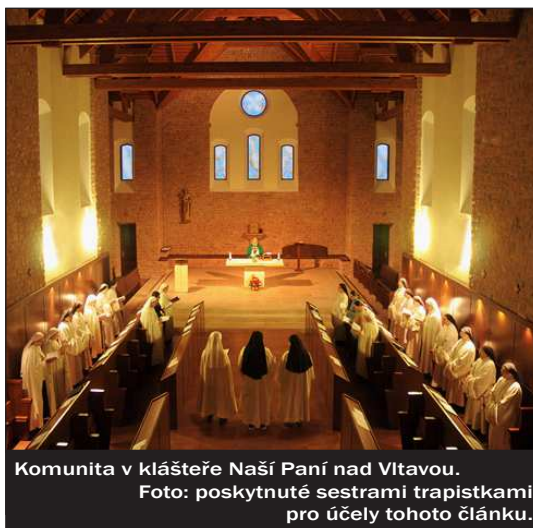
Komunita v klášteře Naší Paní nad Vltavou.

Maltéžští rytíři tedy uplatňují podobnou strategii rekonstrukce identity jako řád sester voršilek, ovšem ve „větším stylu“. Ještě důrazněji a explicitněji staví na řádové tradici a historii. Také prakticky uzavírají období mezi lety 1950 - 1989 jako pro řád málo významné a zanedbatelné. V rám-