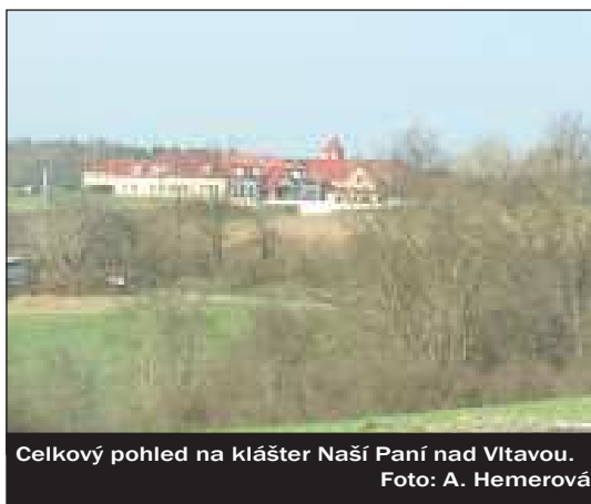
Celkový pohled na klášter Naší Paní nad Vltavou.

Z provedených rozhovorů také vyplývá, jak moc je důkladný systém výběru členů určující pro vlastní sebeidentitu členů. Když dochází k situaci, kdy o členství v řádusám žádá nevhodný kandidát, vyvolává to až pobavení: „ Taky se nám to stává, a je to hrozně legrační, když někdo přijde a hlásí se nám o členství. No to nejde!! Ten řád si sám vytipovává a oslovuje eventuální adepty, a pokud adept souhlasí, tak se s ním potom rozjede přijí-