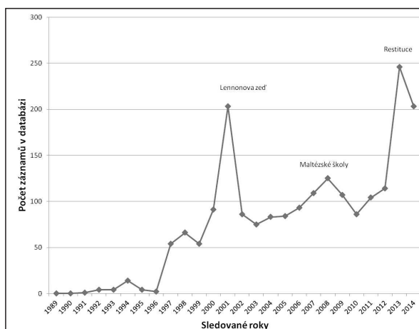
Mediální referování o řádu maltézských rytířů v letech 1989–2014.

sledky zde neuvádíme, protože nejsou doplněny příslušnými portréty řeholních společenství) ukázala, že řády své místo v očích veřejnosti stále vytvářejí a do určité míry obhajují. V tomto směru má nejlepší pozici Řád maltézských rytířů, jehož charitativní práce je na tolik společensky prospěš-