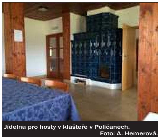
Jídelna pro hosty v klášteře v Poličanech.

V kombinaci s jejich nemluvností se setkání s nimi stává vzácným okamžikem, a jejich role je tak ozvláštňena o tajemství, na základě kterého ve společných prostorách domu pro hosty vznikají tiché diskuze hostů, jejichž hlavním tématem jsou právě trapistky. Hosté si pak vzájemně pomáhají poskládat si obrázek