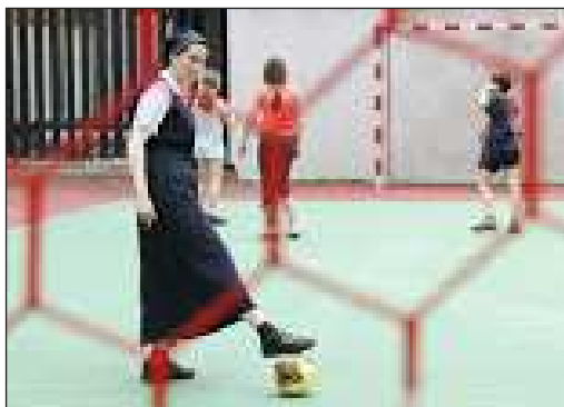
Sestry často hrají s dětmi fotbal. Ten zařadily i do programu pro veřejnost během Dnů víry 2015. Ukazují se tedy pro mnohé v překvapivém světle.

otevřenost vůči veřejnosti a snaha o držení kroku s moderní dobou, což je poměrně zásadní pro práci s dětmi a mládeží. Dynamický přístup k činnosti a schopnost adaptovat se na nastalé změny jim umožňují již samotné stanovy řádu. 17