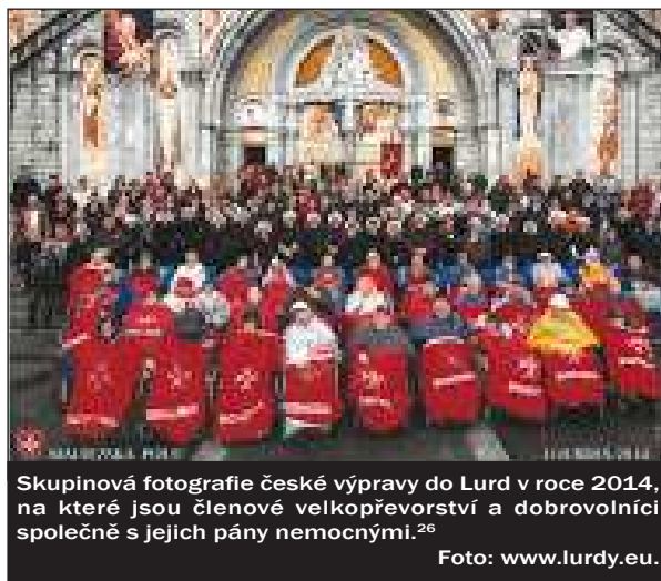
Skupinová fotografie české výpravy do Lurd v roce 2014, na které jsou členové velkopřevorství a dobrovolníci společně s jejich pány nemocnými. 26