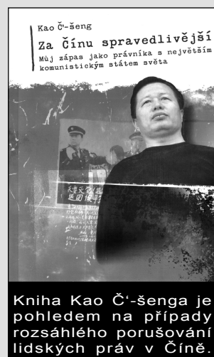
Kniha Kao Č'-šenga je pohledem na případy rozsáhlého porušování lidských práv v Číně.