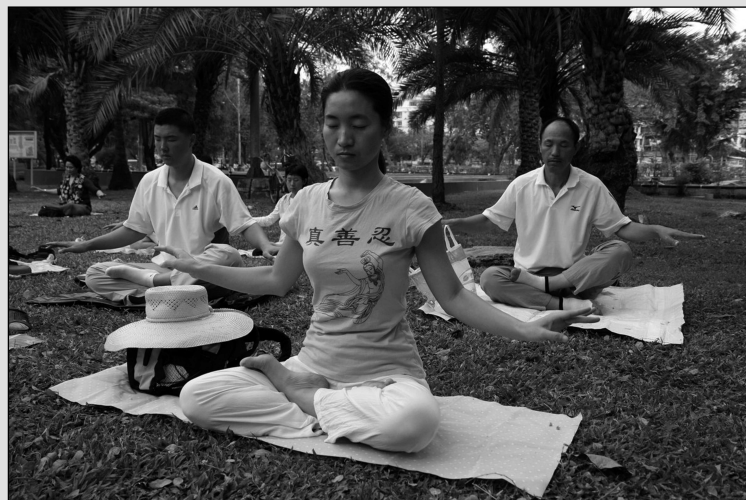
Připravil Zdeněk Vojtíšek.