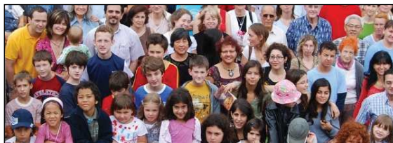
Na rozdiel od Českej republiky jsou slovenští bahá'í registrováni státem (pod názvem Bahá'íjské spoločenstvo). Ve světě zajišťují víře bahá'í proslulost především originální chrámy, jako např. v Dillí.

Pozrime sa teraz bližšie na spomenutý pokles tradičnej religiozity. Najpočetnejšou cirkvou s výrazným odstupom ostáva Rímskokatolícka cirkev, hlási sa k nej 62% obyvateľov, čo je takmer o 7 % menej ako pred desiatimi rokmi, ale stále viac ako v roku 1991. Napriek niektorými sociológmi proklamovanému neúspechu politiky cirkvi, zdôrazňovaniu úbytku počtu veriacych a nedôvery v jej organizovanej podobe, 3 môžeme konštatovať istú stabilitu. Po zohľadnení problémov pri sčítaní a so zreteľom na ostatné faktory, ako je vysoký podiel ľudí, ktorí sa odmietli sčítania zúčastniť, resp. nevyplnili kolónku vierovyznanie, sa nakoniec dostaneme k rovnakému číslu, resp. o niečo väčšiemu ako bolo pred 10 rokmi. I keď zo strany cirkevných predstaviteľov prišlo k akémusi rozčarovaniu z výsledkov a ich pripisovaniu dôsledkom štyridsaťročnej ateizácie, 4 môžeme hovoriť o kontinuálnej náboženskej situácii v Katolíckej cirkvi (či už medzi rímskymi katolíckymi alebo gréckokatolíckymi).