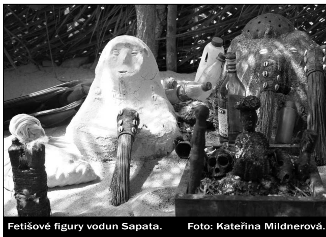
Fetišové figury vodun Sapata.

Kultury vodun již od svého vzniku úzce koexistovaly a prolínaly se s kultury rodinových a královských předků. Na rozdíl od