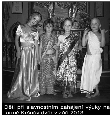
Děti při slavnostním zahájení výuky na farmě Kršnúv dvůr v září 2013.