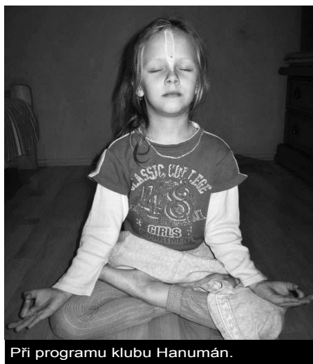
Při programu klubu Hanumán.

zaly programy, které hnutí Haré Kršna nabízí školám a školkám. Jak tyto programy probíhají, se dozvídáme z několika videozáznamů umístěných na serveru www.youtube.com . Několik členů hnutí vždy přijede do školy či školky, která projeví zájem. V rámci připraveného programu vyprávějí dětem příběhy z Kršnova života, naučí je písničku, tanec, nechají je zapálit tyčinku a nakonec za odměnu dětem rozdají obrázky Kršny a nějakou tu sladkost. O skutečném uctívání Kršny se příliš nemluví. Na první pohled by se zdálo, že se jedná o velmi pěknou aktivitu, která má českým školákům přiblížit některé prvky života v Indii – tak je také program prezentován. Pokud se ale podíváme pod povrch jednotlivých úkonů a do učení hnutí, misijní role této aktivity je zcela nasadě. Písničky a tance, které oddaní ve škole děti učí, jsou