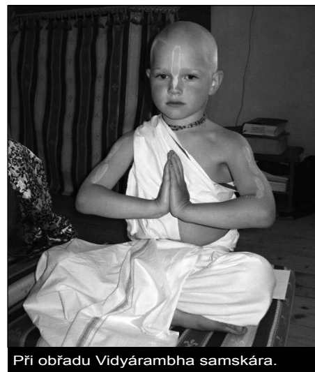
Při obřadu Vidyarambha samskára.