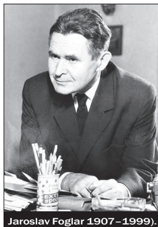
Jaroslav Foglar 1907–1999.

Začneme-li v prostředí Foglarova oddílu, tedy tam, kde bylo žité zakoušení foglaringu nejintenzivnější, je skutečně nápadné, jak vyvinutý smysl pro rituály Foglar ve vedení oddílu projevoval. Roční cyklus oddílových činností měl povahu