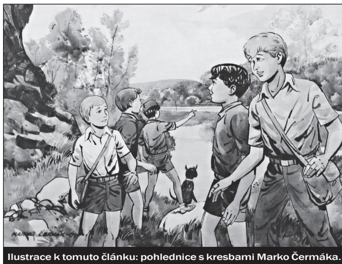
Ilustrace k tomuto článku: pohlednice s kresbami Marko Čermáka.

vými momenty v historii kolektivu mají být připomínány svátečními obřady, duše kolektivu je spojena s posvátnými symboly, jako je pokřik, heslo, písně, odznaky, členské legitimace. Vstup do idealizovaného kolektivu je buď nemožný nebo velmi obtížný a každopádně je doprovázen sérií iniciačních rituálů. Religionistická perspektiva umožňuje ve Foglarově idealizovaném kolektivu identifikovat většinu definičních znaků svatého bratrstva.